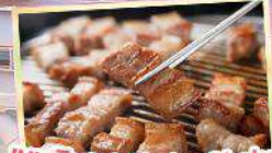
เมนูพิเศษ! Shabu Shabu และ BBQ สไตล์เกาหลี