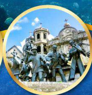
อนุสาวรีย์มรดกแห่งเซบู