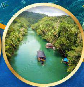
ล่องเรือแม่น้ำไลบ็อก