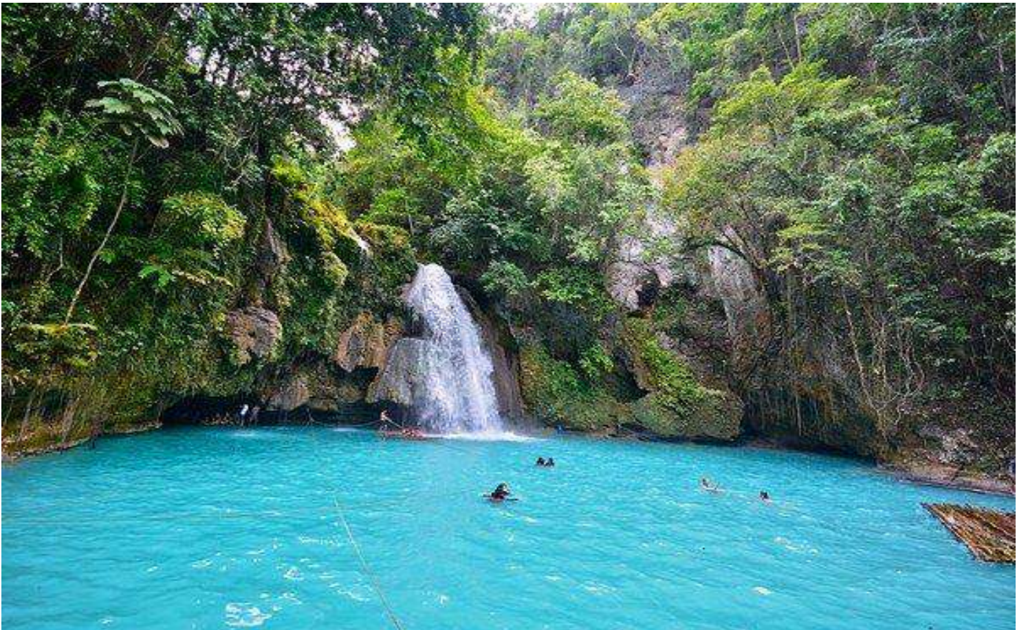
GO1CEB-5J102 CEBU Mabuhay Sea. Sand. Smile. ดำน้ำชมฉลามวาฬ เกาะโบโฮล 4วัน2คืน โดยสารการบิน Cebu Pacific (5J)