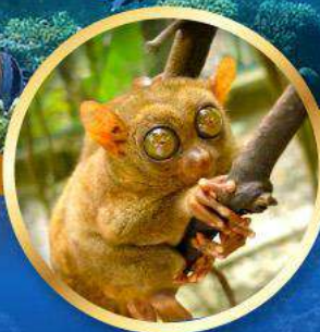
ลิงการ์เซีย