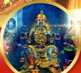
วัดบิกโตฮองอำ