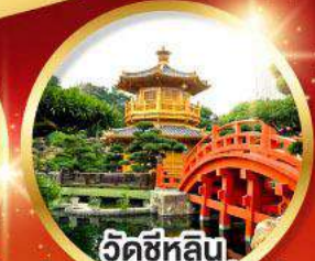
วัดชีหลิน (สวนหนานเหลียน)