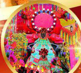
วัดเจ้าแม่กวนอิมฮองอำ