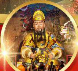
วัดเซกง 600 ปีหยุนหลอง