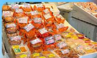
ตลาดปลาโจโก