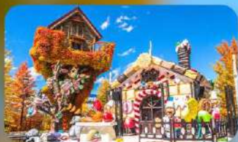
โรงงานช็อกโกแลต ชิโรอิ โคอิบิโตะ