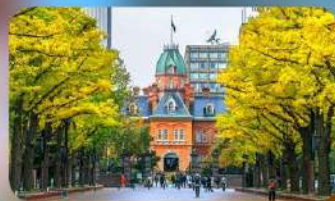
อิสระตามอัธยาศัย 1 วัน