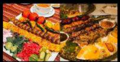
อาหารท้องถิ่นอิหร่านสุดพิเศษ