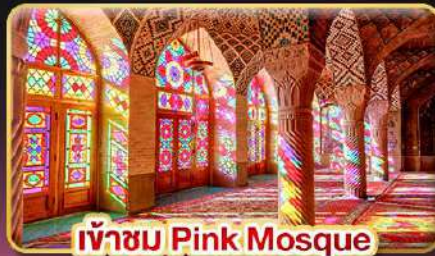
เข้าชม Pink Mosque