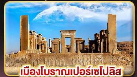
เมืองโบราณเปอร์เซโปลิส

✈️ บินตรง กรุงเทพฯ - เตหะราน บินภายใน ชีราซ - เตหะราน