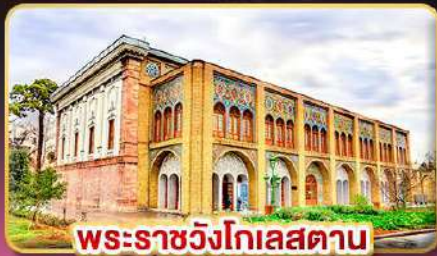
พระราชวังโกเลสถาน

เยือนอารยธรรมเปอร์เซีย เก็บครบทุกไฮไลต์สำคัญ