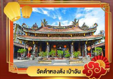
วัดต้าหลงตั้ง เป่าอัน