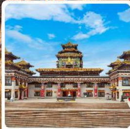
ทำเนียบพระลามะอูหลาน