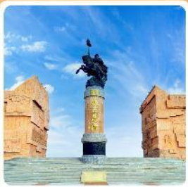
เขตท่องเที่ยวเจงกีสข่าน