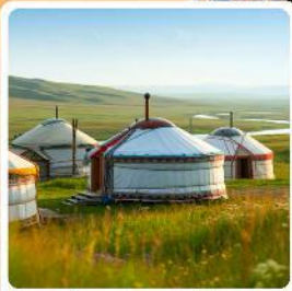
ที่พักแบบกระโจ