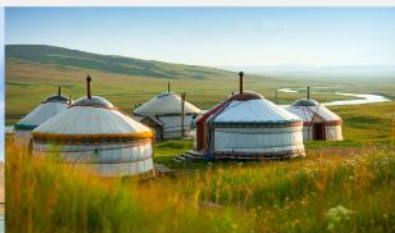
ที่พักแบบกระโจม