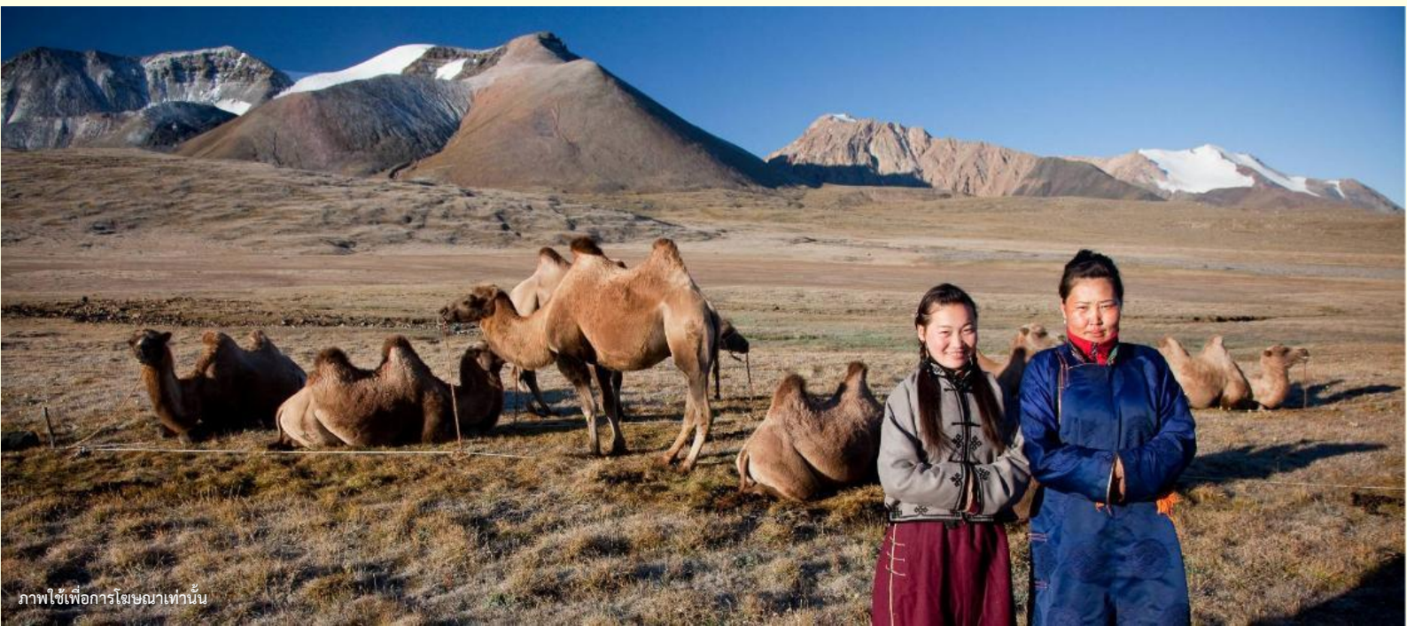
ภาพใช้เพื่อการโฆษณาเท่านั้น

นำท่านร่วมกิจกรรม พิธีต้อนรับแขกสไตล์มองโกล เป็นประเพณีโบราณที่มีมาช้านาน ชาวมองโกลมีอุปนิสัยที่รักเพื่อนฝูงและตรงไปตรงมาไม่เสแสร้ง เมื่อมีเพื่อนหรือแขกมาเยือนก็มักจะผูกมิตรอย่างจริงจัง และนำท่านร่วมกิจกรรม สวมใส่ชุดมองโกล สัมผัสพลังแห่งบรรพบุรุษ สวมเสื้อคลุมแบบดั้งเดิมที่มีสีสันสดใส ปักลวดลายอันประณีต คุณจะสัมผัสได้ถึงพลังแห่งบรรพบุรุษที่เคยปกครองดินแดนครึ่งโลก การสวมหมวกขนสัตว์ ผูกสายรัดเอว พร้อมเครื่องประดับเงินแท้ที่ส่องแสงระยิบระยับ จะทำให้ท่านเสมือนกลายเป็นนักรบแห่งทุ่งหญ้า พร้อมเครื่องประดับเงินแท้ที่ส่องแสงระยิบระยับ ของชนเผ่าที่เคยปกครองดินแดนครึ่งโลก เมื่อคุณยืนท่ามกลางทุ่งหญ้าไร้ขอบเขต