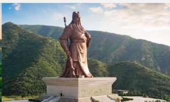
บ้านเกิดท่านกวนจู