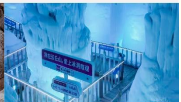
ถ้ำน้ำแข็งอวี่นชีวชาน