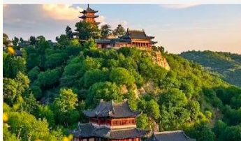
เขาเหยาหวังชาน