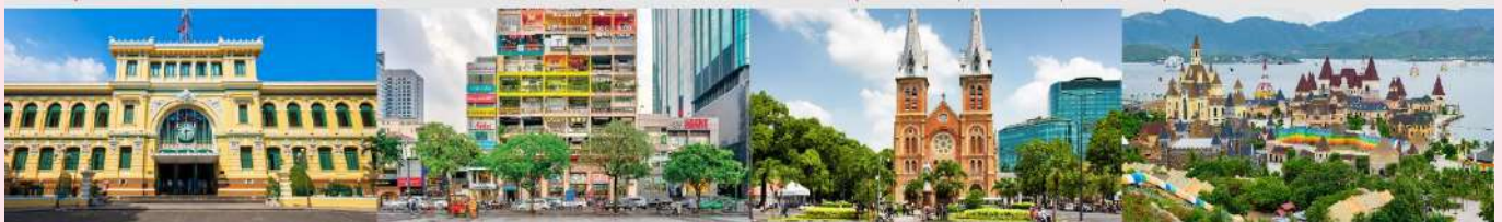
ไพรชฌ์กลางโฮจิมินห์