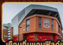
เยือนต้นแอนฟิลด์และโอลด์แทรฟฟอร์ด