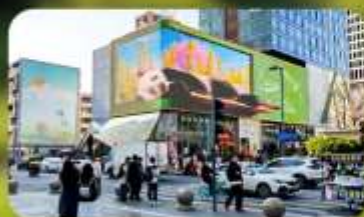
ไท่กุ่หลี่