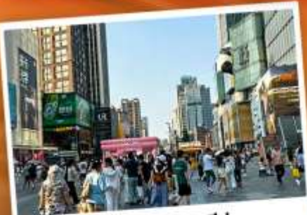
ถนนคนเดินชุนชี่อู่