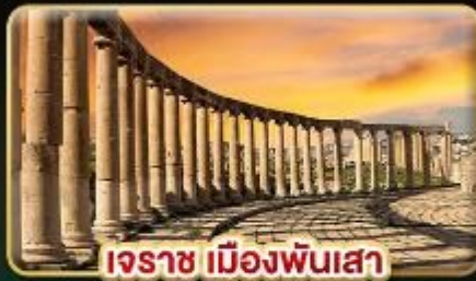
เอรราช เมืองพันเสา