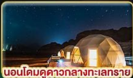
นอนโดมคูดาวกลางทะเลทราย

📅เดินทาง: 17-24 ต.ค. | 06-12 ธ.ค. 69 26 ธ.ค. 69 - 02 ม.ค. 70