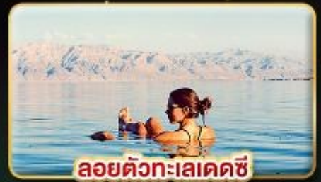
ลอยตัวทะเลเดดซี