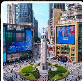
ถนนเจียฟางเป็ย