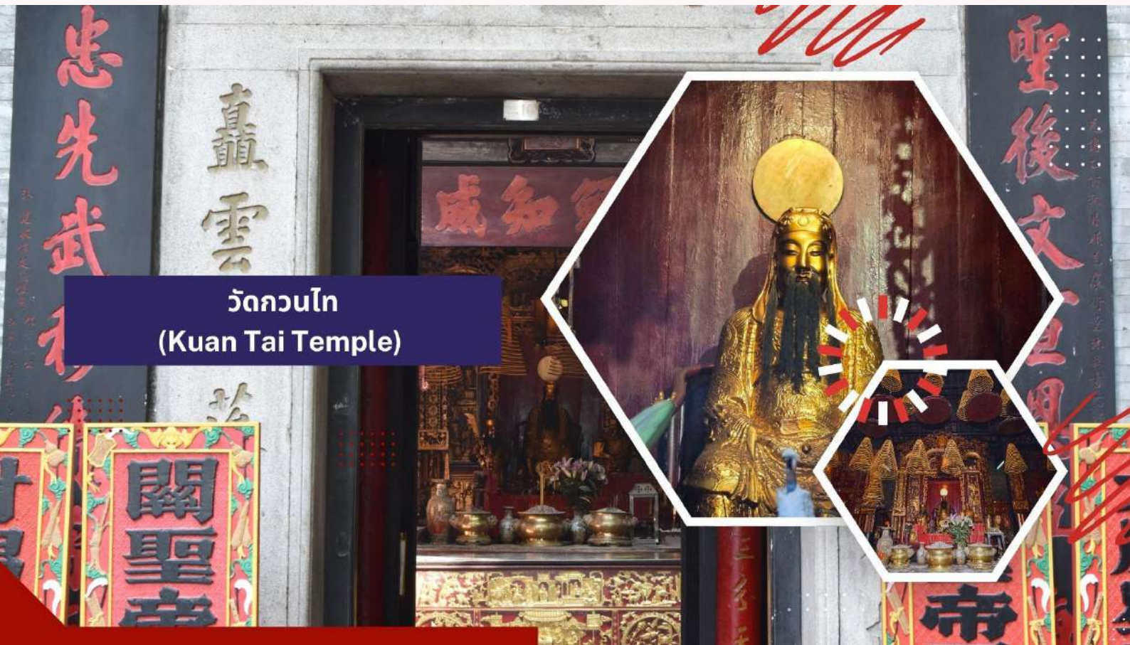
วัดกวนไท (Kuan Tai Temple)

นำท่านเดินทางสู่ วัดกวนไท (Kuan Tai Temple) หรือรู้จักกันในชื่อ วัดซาไกวุกุณ (Sam Kai Vui Kun Temple) เป็นวัดที่มีความสำคัญทางประวัติศาสตร์และวัฒนธรรมในมาเก๊า ได้รับการขึ้นทะเบียนเป็นมรดกโลกของ UNESCO ร่วมกับศูนย์กลางประวัติศาสตร์มาเก๊าในปี ค.ศ. 2005 เนื่องจากคุณค่าทางประวัติศาสตร์ สถาปัตยกรรม และวัฒนธรรมที่โดดเด่น ตั้งอยู่ใจกลางจัตุรัสเซนาโด้และรายล้อมไปด้วยอาคารสไตล์ยุโรป วัดนี้สร้างขึ้นเมื่อปี ค.ศ. 1750 และเป็นที่ยึดเหนี่ยวจิตใจของชาวมาเก๊า ซึ่งเป็นเทพเจ้าแห่งความมั่งคั่งและปกป้องคุ้มครอง วัดแห่งนี้มีเป็นที่นิยมของ ผู้ทำธุรกิจ ตำรวจ และนักการเมือง เพราะเชื่อว่าสามารถปกป้องสิ่งชั่วร้ายต่างๆ และช่วยเสริมอำนาจบารมีในการ ปกครองและคุ้มครองปรีวาร