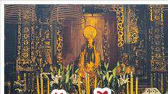
วัดกวนไท้