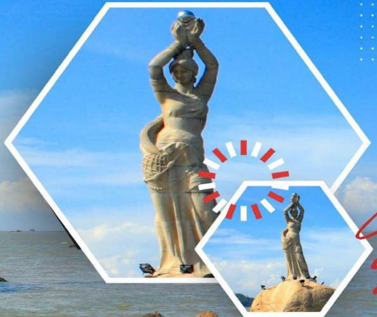
จูไห่ ฟิชเชอร์ เกิร์ล (Zhuhai Fisher Girl)

นำท่านชม จูไห่ ฟิชเชอร์ เกิร์ล (Zhuhai Fisher Girl) สัญลักษณ์อันสวยงามโดดเด่นของเมืองจูไห่ หรือมีอีกชื่อเรียกว่า “หวิหนี่” ตั้งอยู่บริเวณอ่าวเซียงหู เป็นรูปปั้นสาวงามยืนถือไข่มุกอยู่ริมทะเล ซึ่งเป็นลักษณะบ่งบอกถึงความสงบสุข ความอุดมสมบูรณ์รุ่งเรืองแห่งเมืองจูไห่นั้นเอง