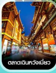
ตลาดเดินหัวงเมี่ยว

✈️ คอนเฟิร์มออกเดินทาง ✈️ ทุกพีเรียด 2 ท่านขึ้นไป