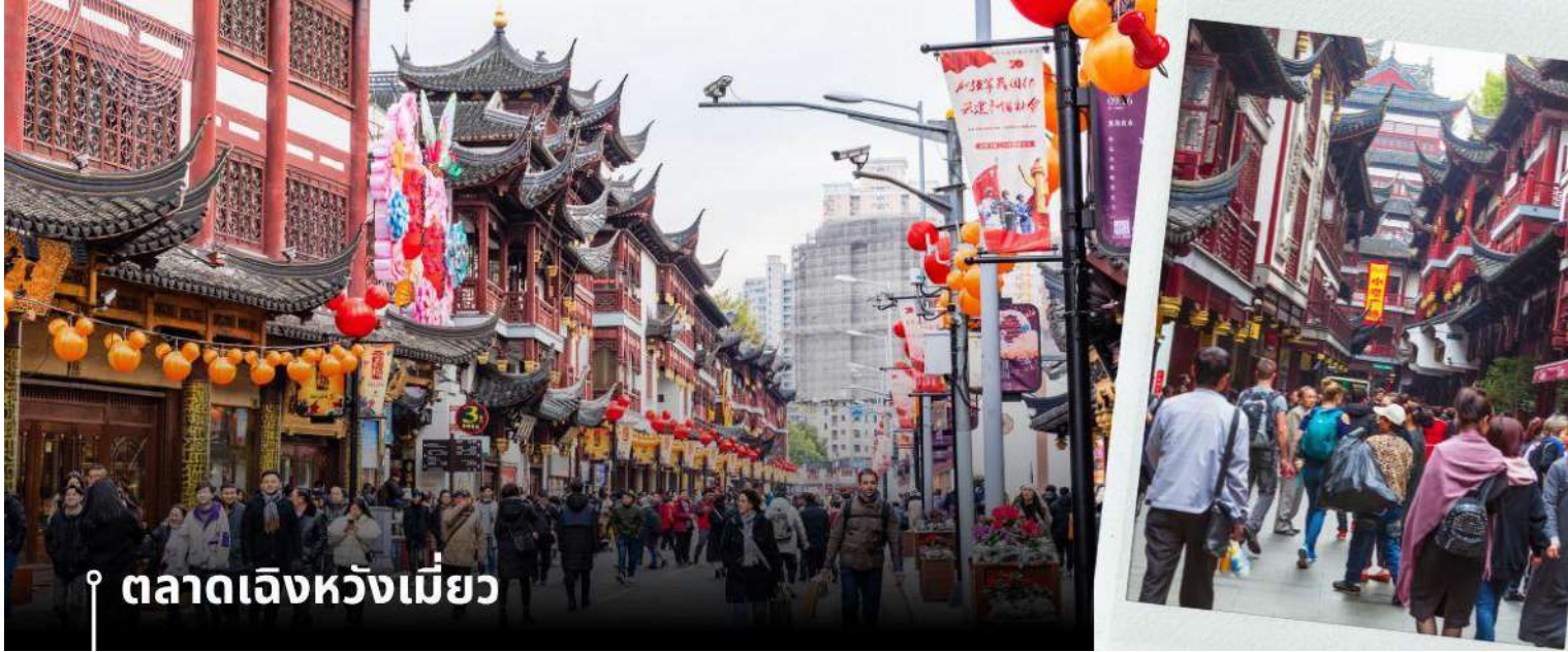
📍 ตลาดเจิ้งเหมียว

จากนั้นนำท่านสู่ ตลาดเจิ้งเหมียว เป็นศูนย์รวมสินค้า และอาหารพื้นเมืองที่แสดงถึงเอกลักษณ์ของชาวเซี่ยงไฮ้ซึ่งมีการผสมผสานระหว่างอดีตและปัจจุบันได้อย่างลงตัว ซึ่งเป็นย่านสินค้าราคาถูกที่มีชื่ออีกย่านหนึ่งของนครเซี่ยงไฮ้ ให้ท่านอิสระช้อปปิ้งตามอัธยาศัย