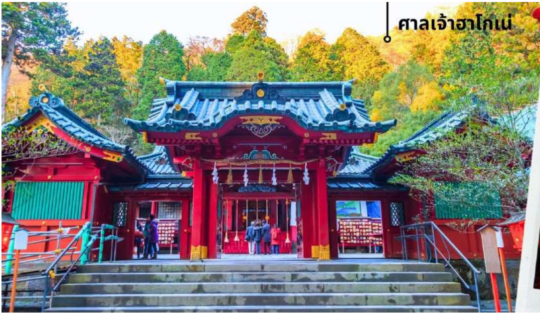
ศาลเจ้าฮาโกเน่