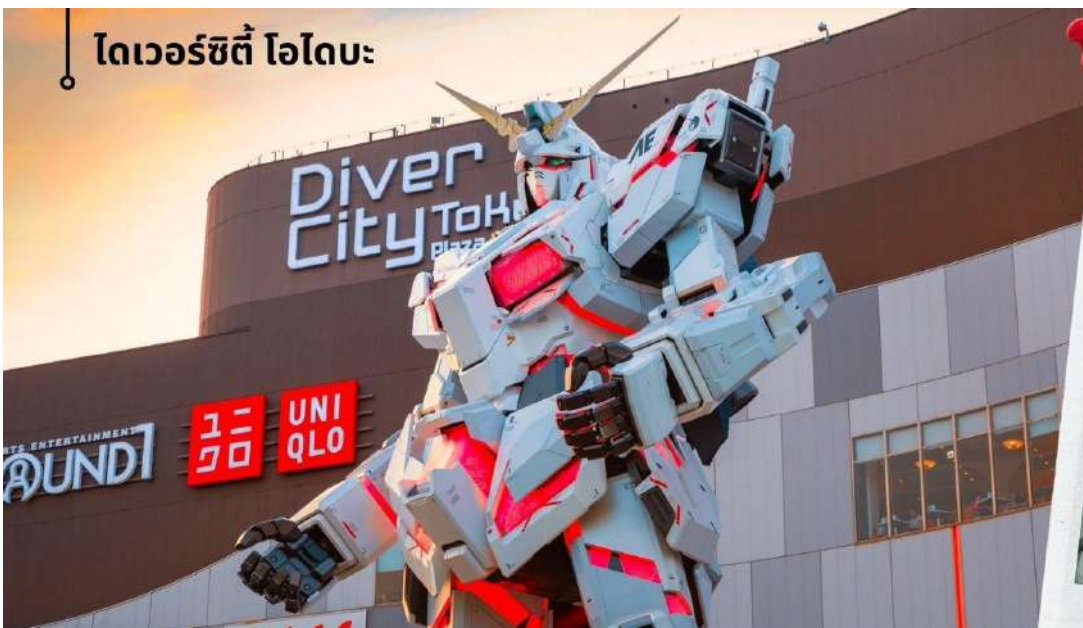
ไดเวอร์ซิตี โอโดบะ

จากนั้นนำท่านสู่ ไดเวอร์ซิตี โอโดบะ Diver City Plaza เป็นเกาะจำลองขนาดใหญ่ ซึ่งสร้างขึ้นจากการถมทะเลบริเวณอ่าวโตเกียว เดิมโตขึ้นอย่างรวดเร็วในฐานะเขตท่าเรือจนถึงช่วงทศวรรษที่ 1990 โอโดบะ ได้กลายเป็นย่านการค้ามี ห้างสรรพสินค้าขนาดใหญ่ที่พักอาศัยและแหล่งนันทนาการที่ใหญ่โตแห่งหนึ่งให้ท่านได้ชม Unicorn Gundam หุ่นกันดั้มตัวใหม่เป็นรุ่น RX-0 Unicorn Gundam ในโหมด Destroy เป็น หุ่นสีขาว-แดงมีความสูงประมาณ 24 เมตร สูงกว่าหุ่นตัวเดิมถึง 6 เมตร และซ้อปิ้งตามอัธยาศัย