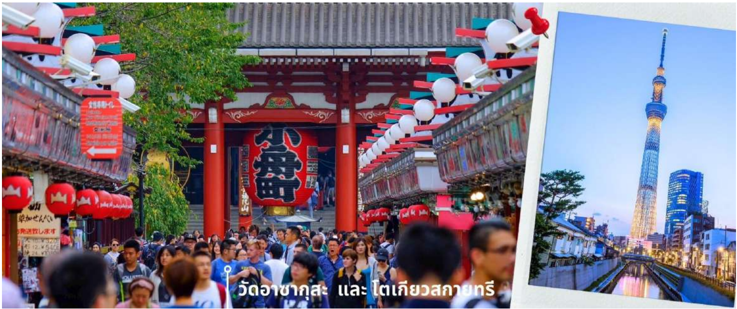
วัดอาซากุสะ และ โตเกียวสกายทรี

พอสมควรแก่เวลา พาท่านเดินทางเข้าสู่ย่าน ช้อปปิ้งชินจูกุ Shinjuku แหล่งช้อปปิ้งชื่อดังในโตเกียวให้ท่านอิสระและเพลิดเพลินกับการช้อปปิ้งสินค้ามากมายทั้งเครื่องใช้ไฟฟ้ากล้องถ่ายรูปดิจิตอลนาฬิกา เครื่องเล่นเกม หรือสินค้าที่จะเอาใจคุณผู้หญิงด้วยกระเป๋ารองเท้า เสื้อผ้าแบรนด์เนม เสื้อผ้าแฟชั่นสำหรับวัยรุ่น เครื่องสำอางยี่ห้อดังของญี่ปุ่นไม่ว่า