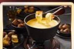
เมนูพิเศษ!! สวิสฟองดู

เบิร์น เวเวย์ เซอร์แมท อินเทอร์ลาเกน ทิตลิส ลูเซิร์น ซูริก