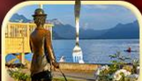
ชาลี แฮปป์ลิน THE FORK