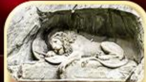
สิงโตหินแกะสลัก