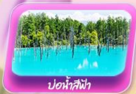
บ่อน้ำสีฟ้า