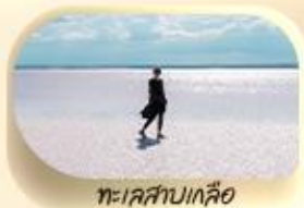
ทะเลสาบเกลือ