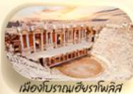
เมืองโบราณฮิราโพลิส