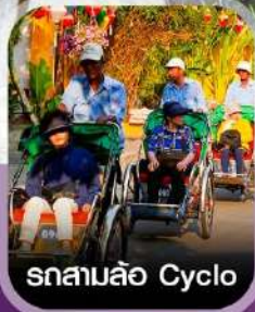
รถสามล้อ Cyclo

✈️ คอนเฟิร์มออกเดินทาง ✈️ ทุกพีเรียด 2 ท่านขึ้นไป