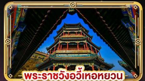
พระราชวังอู่เหอหยวน