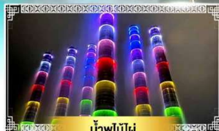
น้ำพุไม้ไผ่