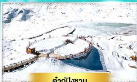
คำกู่ปิงชวน