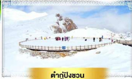
ต่ากู่ปิงชว่น