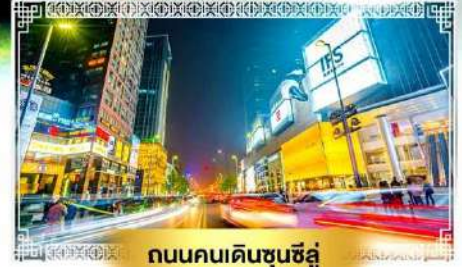
ถนนคนเดินชุนซีลู่