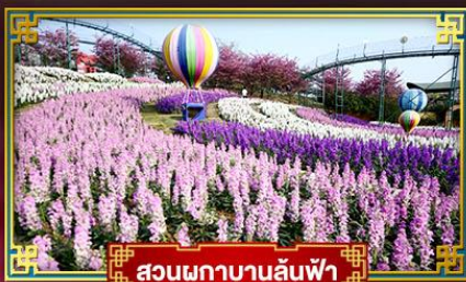
สวนผกาบานล้นฟ้า

อุทยานสวรรค์ภูผาหิมะการ์เซียต้ากู่ปิงชว่น