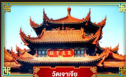
วัดจาเจีย