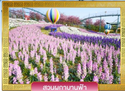
สวนพกาบานฟ้า