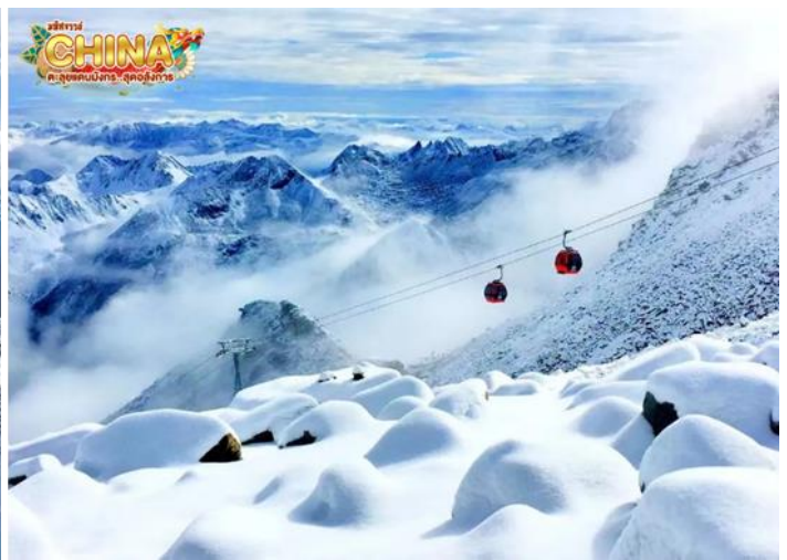
(หมายเหตุ: ปริมาณหิมะขึ้นอยู่กับสภาพอากาศ)

กลางวัน ๑๑ บริการอาหารกลางวัน ณ ภัตตาคาร