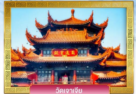
วัดจาเจีย