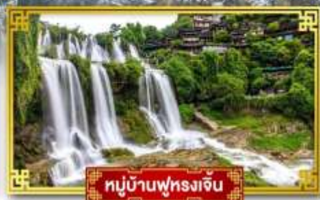
หมู่บ้านฟุ่หลงเจิน