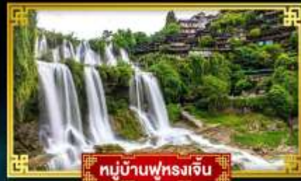
หมู่บ้านฟุหลงเจิ่น