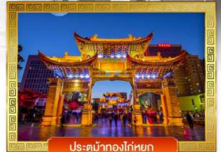
ประตูน้ำทองโก่หยก