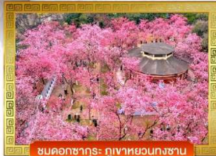
ชมดอกซากุระ ภูเขาหยวนกงซาน