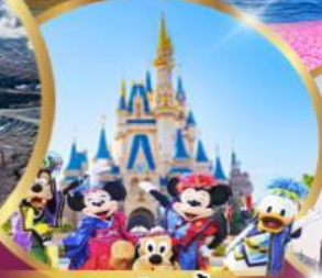
อิสระเลือกซื้อ Tokyo Disneyland