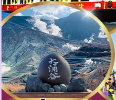
หุบเขาโอวาคุดานิ