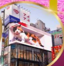
ช้อปปิ้ง ย่านชินจูกุ