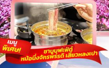
เมนูพิเศษ! ชาบูบุฟเฟ่ต์ หม้อหนึ่งจักรพรรดิ เสวยหลงเป่า