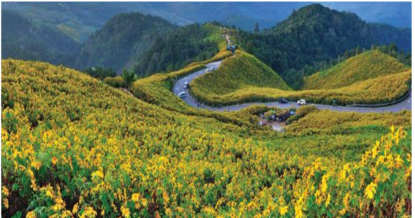
ได้เวลาอันสมควรนำคณะออกเดินทางสู่ อำเภอแม่สะเรียง ตามเส้นทางขุนยวม-แม่สะเรียง