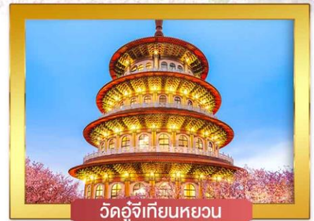
วัดอู่จีเทียนหยวน