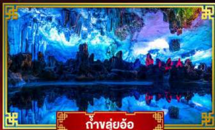
ถ้ำลุย้อ

"ดินแดนแห่งสายน้ำและขุนเขา" สัมผัสประสบการณ์นั่งบอลลูนชมวิวมุมสูง