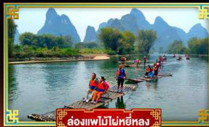
ล่องแพไม้ไผ่หยี่หลง