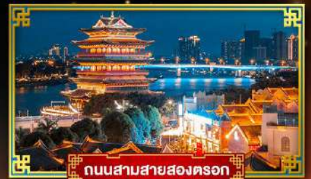
ถนนสามสายสองครอก