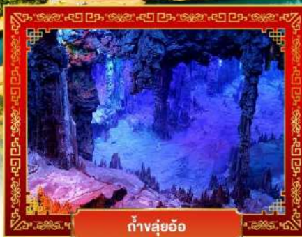
ถ้ำลู่ย้อ