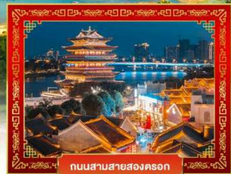
ถนนสามสายสองตอ