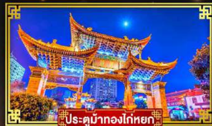
ประตูม้าทองโก่หยก