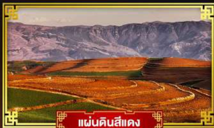
แผ่นดินสีแดง