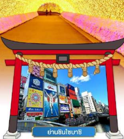
ย่านชินจูกุ