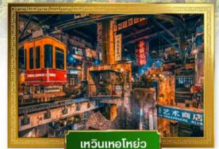
เหวินเหอไห่ยว่