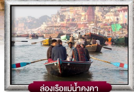
ล่องเรือแม่น้ำคงคา