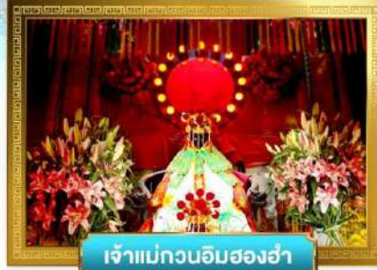
เจ้าแม่กวนอิมสองอำ