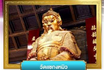
วัดเข่งหมิว