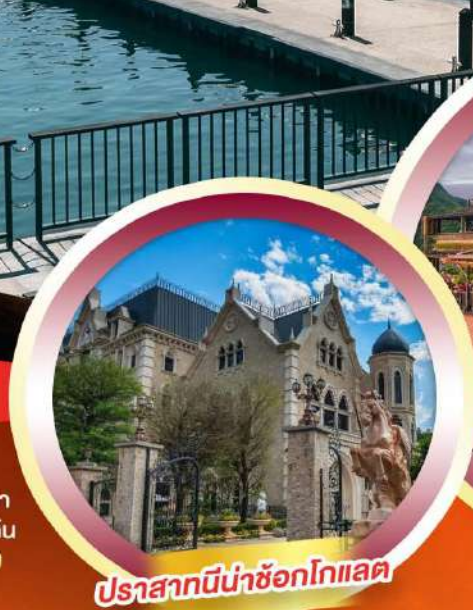
ปราสาทน้ำช็อกโกแลต