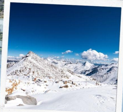
ภูเขาหิมะการ์เซีย ตำกู่ปิงชวน