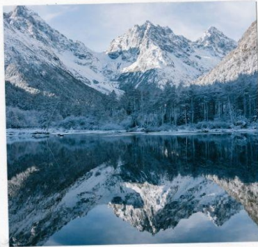
อุทยานปีเหมิงโกว