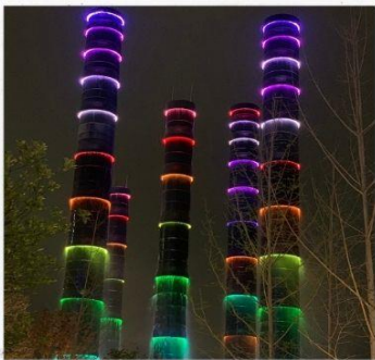
ชมแสงสีห้าง SKP