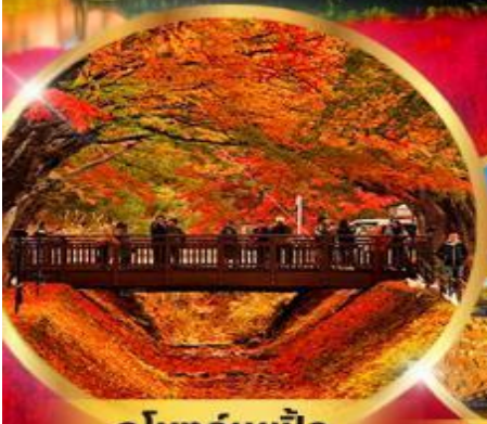
อุโมงค์เมเปิ้ล