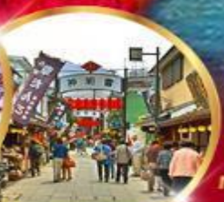
ย่านโบราณ ชิชะมาตะ

34,919 ราคา เริ่มต้น บาท รวมภาษีมูลค่าเพิ่ม 7%