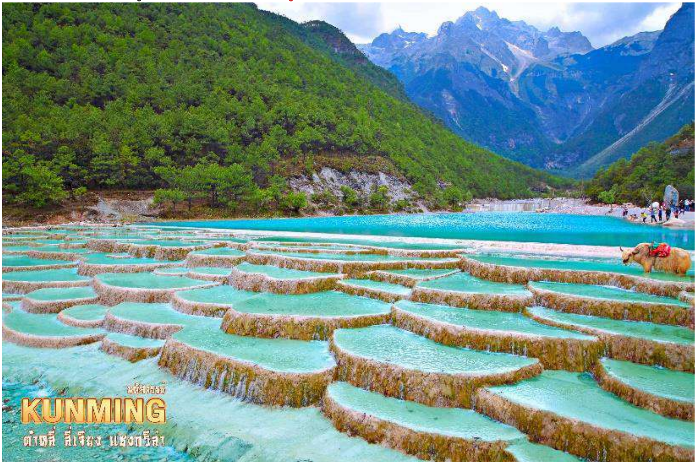
นิตยสาร KUNMING ต้าชี่ สีเจียง แซงกรี่ล่า

ชมความงดงามผืนน้ำสีเทอควยซ์ของ ทะเลสาบไป๋สุยเหอ ทะเลสาบที่อยู่อีกด้านหนึ่งของภูเขาหิมะมังกรหยก น้ำในทะเลสาบแห่งนี้ไหลลงมาจากการละลายของหิมะบนภูเขาหิมะมังกรหยก สามารถเติมชมความสวยของทะเลสาบได้ตลอดระยะทาง 3 กิโลเมตร หรือจะเลือกนั่งรถรับส่งได้ตามสะดวกไปยังจุดท่องเที่ยวยอดนิยม ( รวมค่ารถแบดเตอร์ ) ระหว่างทางเดินเลียบทะเลสาบจะพบเห็นคู่รักชาวจีนที่นิยมมาถ่ายพีริเวดดิ้ง และมีเจ้าหน้าที่คอยพาจามริมาบริการให้นักท่องเที่ยวได้ถ่ายรูป ( ไม่รวมค่าบริการถ่ายรูป ราคาประมาณ 50 หยวน )