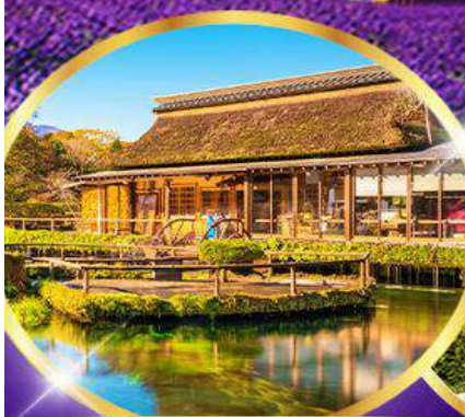
หมู่บ้านโอชิโนะ ฮักโก

อิสระท่องเที่ยว 1 วันเต็ม "วันอิสระเลือกซื้อ Tokyo Disney"