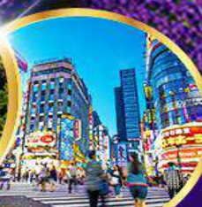
ชิปปิงชินจูกุ