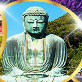
พระใหญ่โคบุทสึ