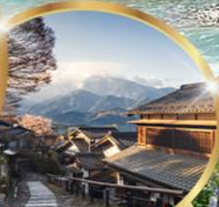
มาโกเมะจุกุ