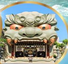
ศาลเจ้านิมะ ยาชากะ