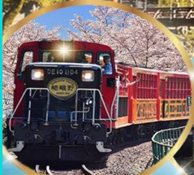
รถไฟสายโรแมนติก