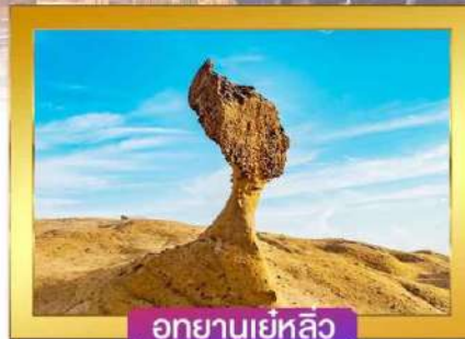
อุทยานเยลโลว์